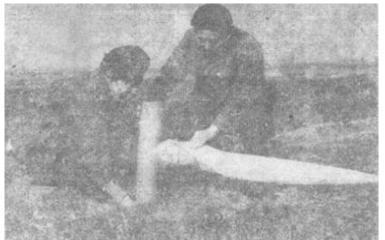
广饶县小张乡农民大力加强冬季麦田管理。图为北赵村的群众在利用防渗渠为小麦浇灌越冬水。

垦利县垦利镇党委、政府,在今年农田水利基本建设中,先上见效快的项目,做到年初动工兴建,年底稻谷增产。今年开春,垦利镇投资63万元,维修了一号扬水站,提高了用水速度,增加了扬水能力,缩短了用水周期;更新了滩区扬水站,扩大浇灌面积5千多亩;开挖了10座水库,蓄水量达100多万立方米;修建了28座建筑物和供电设施,疏通了4条干渠,使全镇水利设施全部配套。由于水源充足,全镇种植的26000亩水稻亩产400余公斤。(黄继国)